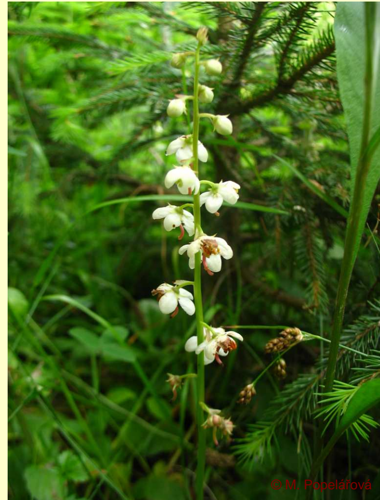
Pyrola rotundifolia (C2)