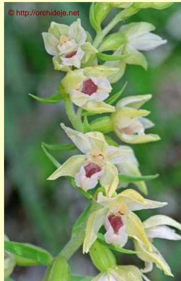
Epipactis muelleri (C2)