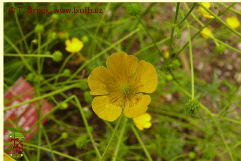
Ranunculus acris subsp. frieseanus