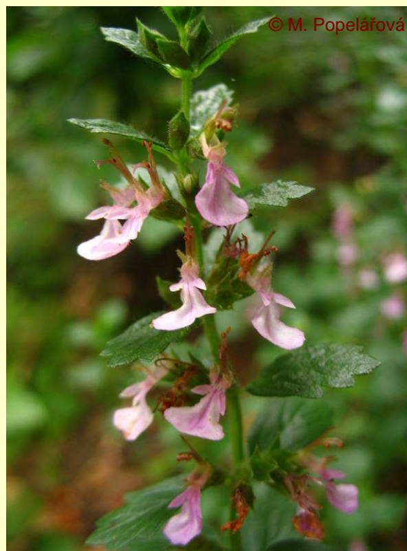
Teucrium chamaedrys (C4a)

Sanguisorba minor Sedum sexangulare Traunsteinera globosa Teucrium chamaedrys – 22 populací (3095 prýtů) Trifolium ochroleucon – 330 exemplářů