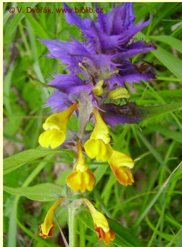
Melampyrum nemorosum var. praecox (C1)