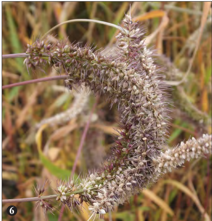
Obr. 5: Laskavec hrubozel ( Amaranthus blitum ). – Obr. 6: Bér přeslenitý ( Setaria verticillata ).

( Potentilla argentea ) a lipnice smáčknutá ( Poa compressa ), v koberce splývala rosička lysá ( Digitaria ischaemum ) a pod pomníky zplaněla nocenka zahradní ( Mirabilis jalapa ).