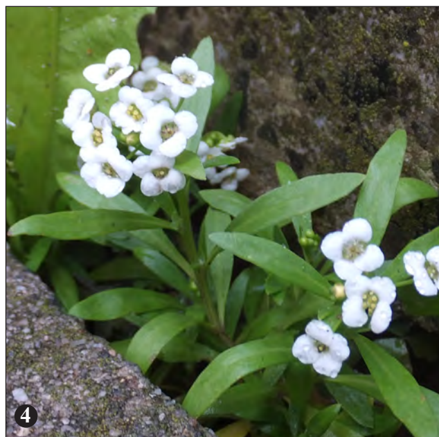
Obr. 1: Rozchodník bledý ( Sedum pallidum ). – Obr. 2: Zvěšinec bledý ( Cymbalaria pallida ). – Obr. 3: Křížatka obecná ( Commelina communis ). – Obr. 4: Tařicovka přímořská ( Lobularia maritima ).

V druhém jmenovaném své místo v pažitě našla jarmanka větší ( Astrantia major ) a kde jinde, nežli právě na hřbitově se dařilo urničce pohárové ( Urnula craterium ). Ve Vésce , nejen názvem milé vsi, široké mezihrobí vyplňoval rozchodník bledý ( Sedum pallidum ) se šruchou zelnou ( Portulaca oleracea ) a ve Vlkovicích hroby opouštěl zvěšinec bledý ( Cymbalaria pallida ).